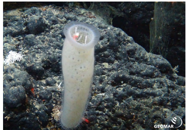
Ein Schwamm am Meeresgrund.

Die Forschungsziele der Wissenschaftler teilten sich in viele unterschiedliche Bereiche auf. Die Hälfte der Forscher an Bord