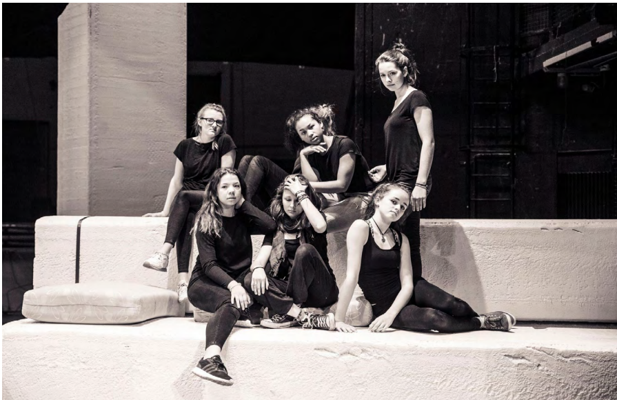
Aufnahmen aus den Proben.

Berlin, Ende der Zwanzigerjahre – eine Großstadt im „Dreigroschenfieber“. Im Theater am Schiffbauerdamm wird das neue Werk des jungen Autors Bertold Brecht uraufgeführt, das diesen zum führenden Dramatiker seiner Zeit machen sollte. Die kongeniale Musik des Jungtalents Kurt Weill trägt mit ihren zündenden Songs entscheidend zum fulminanten Welterfolg des Werkes bei. Es ist eine Zeit großer politischer und gesellschaftlicher Umbrüche und Spannungen: wirtschaftliche Krisen, zunehmende Radikalisierung, ein wachsender Nährboden für populistische Bewegungen – mit dieser Situation setzt sich die Dreigroschenoper auseinander.