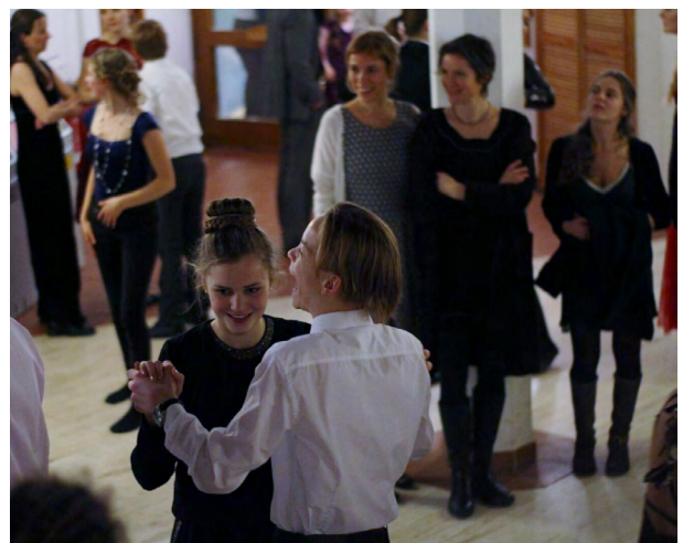
Eindrücke vom Abschlussball: wohlgeordneter Einzug ins Foyer zu Beginn; Ausgelassenheit gegen später.