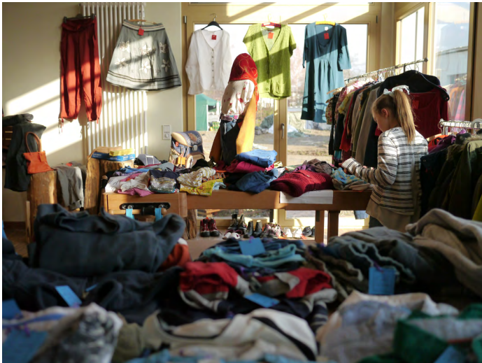
Der Kleiderladen im Neubau kam bei den Besuchern sehr gut an.